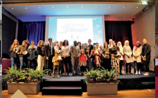
Remise des prix aux gagnants de la Grande Dictée dans le cadre des Journées de la Francophonie (24 mars)