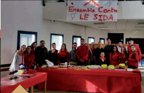
Action des élèves de 1 ère année de BTS du Lycée Alexis de Tocqueville en faveur du SIDACTION (du 23 au 25 mars)