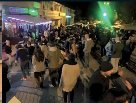
Soirée Corse «Sortir à Grasse» (6 avril)