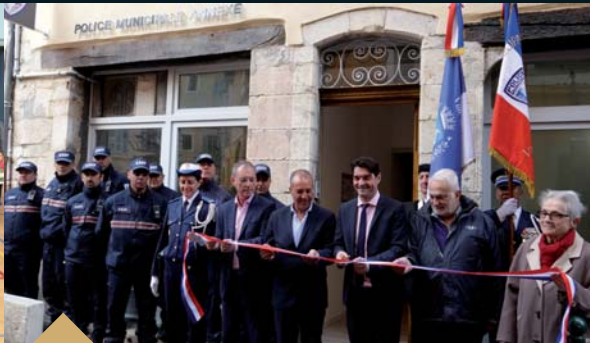
Réception des travaux de la Police Municipale Annexe et de la Maison des Anciens Combattants rue de la Poissonnerie (3 avril)