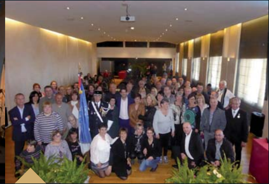
Remise des médailles d'honneur du travail aux agents de la Ville de Grasse (22 mars)