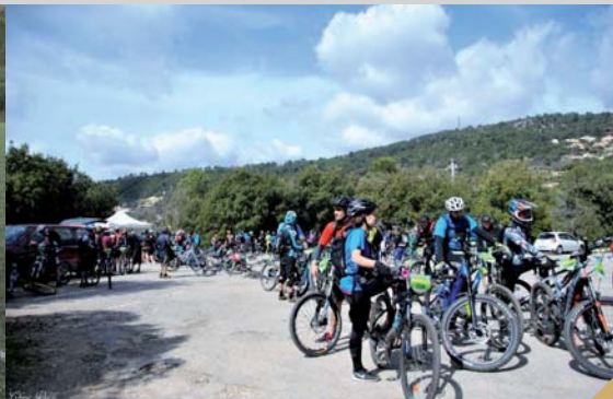
4 ème édition de la Bigreen VTT du Pays de Grasse (2 avril)