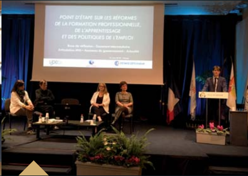
Forum pour l'emploi (21 mars)