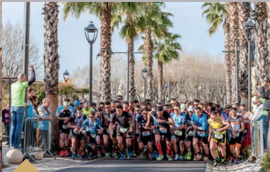
Duathlon de Grasse (8 avril)