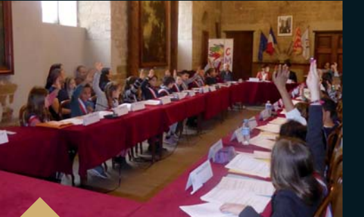
Première séance plénière du Conseil Municipal des Jeunes (24 mars)