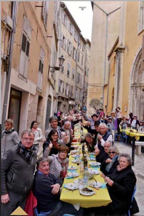
Déjeuner festif de l'association Sou Fassum Grassenc rue de l'Oratoire (8 avril)