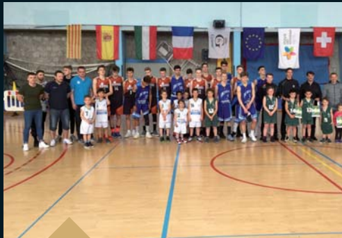
5 ème édition du « CHALLENGE JULIEN » Tournoi international de Basketball (2 avril)