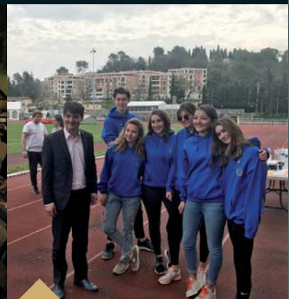
1 ère édition de la «Course de Solidarité» du lycée FENELON, au stade Perdigon (7 avril)