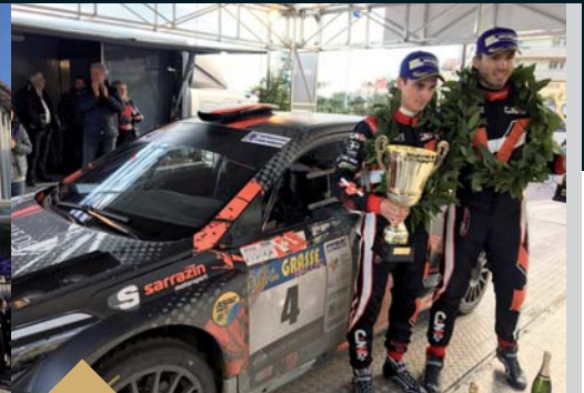
Remise des prix du 59 ème rallye Fleurs et Parfums (31 mars)