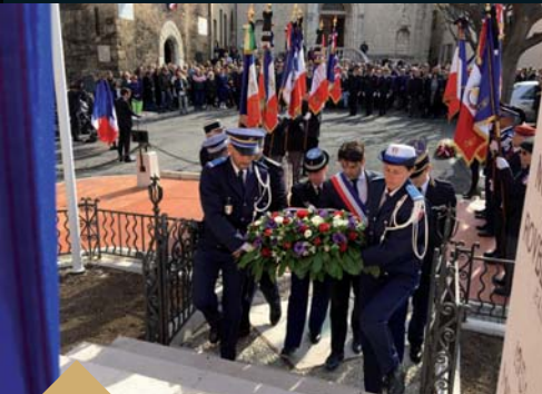
Hommage au Lieutenant-Colonel Arnaud Beltrame et aux Victimes des attaques terroristes de Carcassonne et Trèbes (28 mars)