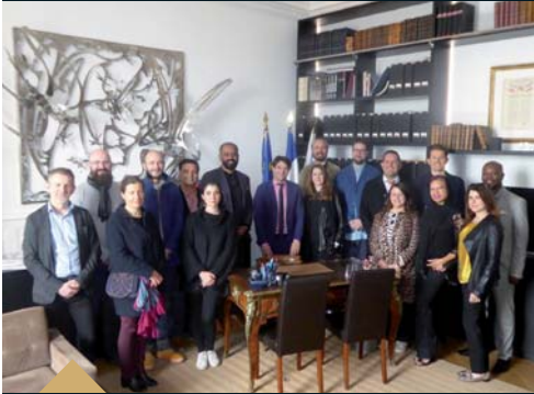
Délégation d'influenceurs mondiaux, venus à l'invitation de la Société Comte de Grasse, spécialisée dans le luxe et les spiritueux (20 mars)

SUR UN MOIS D'ACTIVITÉS PUBLIQUES ET DE MANIFESTATIONS FESTIVES