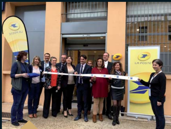
Inauguration des locaux rénovés de La Poste Fragonard (4 avril)