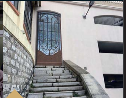
Trompe-l'œil de Vincent DUCARROY situé en prolongement de la rotonde, sur le mur du Parking du Cours (4 avril)