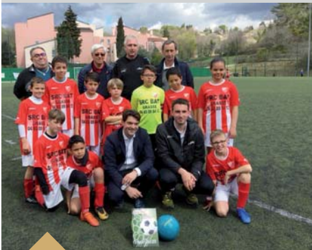
Tournoi Yvon Chilette, organisé par l'Union Sportive du Plan de Grasse (31 mars)