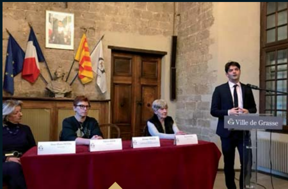
1 ère réunion de concertation dédiée au Nouveau Plan de Rénovation Urbaine pour le Centre Historique de Grasse (14 février)