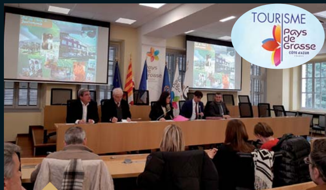
Assemblée Générale de l'Office de Tourisme du Pays de Grasse avec dévoilement du nouveau logo « Tourisme Pays de Grasse » (6 février)