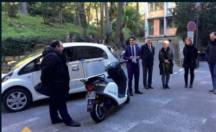
Acquisition par la ville de 4 véhicules électriques (31 janvier)