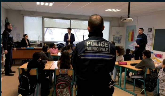
Atelier Civisme à l'école Élémentaire Jean Crabalona (5 février)