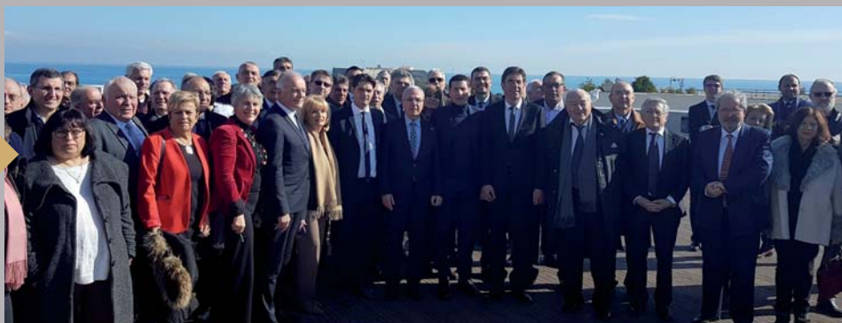
Lancement du Pôle Métropolitain qui réunit les 4 EPCI (Établissement Public de Coopération Intercommunale) de Sophia Antipolis, Cannes-Lérins, Préalpes d'Azur et Pays de Grasse (8 février)