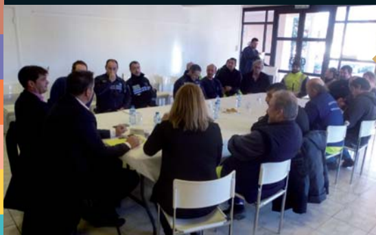
Revue de quartier à Plascassier (18 janvier)

SUR UN MOIS D'ACTIVITÉS PUBLIQUES ET DE MANIFESTATIONS FESTIVES