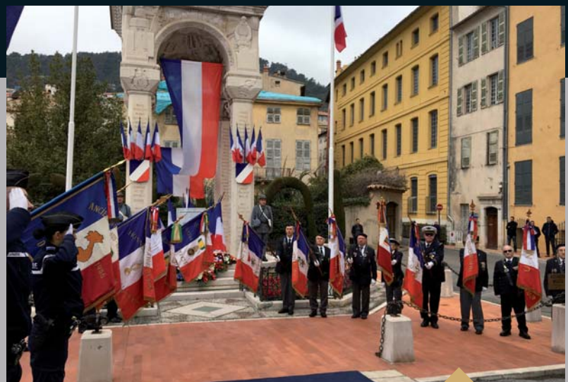
Cérémonie d'Hommage National aux Morts de la Gendarmerie, victimes du devoir (16 février)