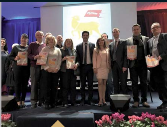
Présentation de l'annuaire 2018 des associations présentes sur notre territoire, réalisé par l'Association Forum (15 février)