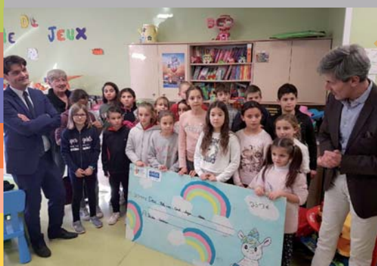
Remise d'un chèque au profit du service pédiatrie de l'hôpital, grâce au projet « Un jeu d'enfants » (31 janvier)