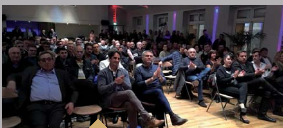
Présentation du 59 ème Rallye Fleurs et Parfums (17 février)