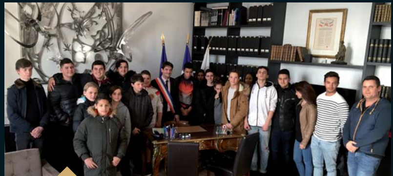
Découverte de l'Hôtel de Ville par les jeunes du Club Ados du LEA (14 février)