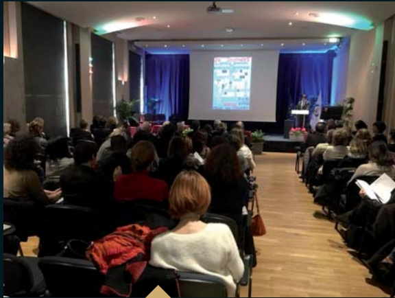
24 ème journée du cercle grassois de gynécologie et d'obstétrique (9 février)