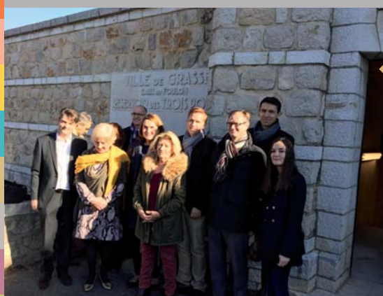
Inauguration de la microcentrale du « Réservoir des 3 Portes », qui produit de l'électricité verte à Grasse (23 janvier)