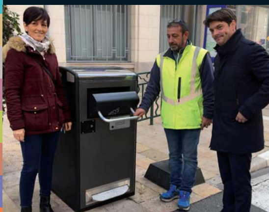
La ville s'équipe de conteneurs connectés intelligents à compactage solaire (22 janvier)