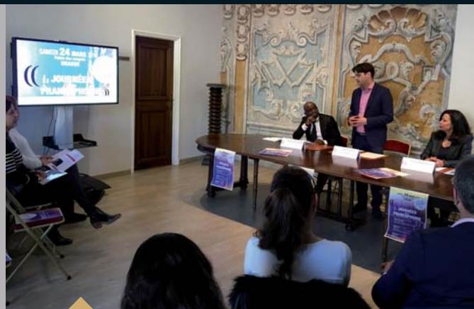
Conférence de presse sur la Journée Internationale de la Francophonie qui se tiendra le 20 mars prochain (7 février)