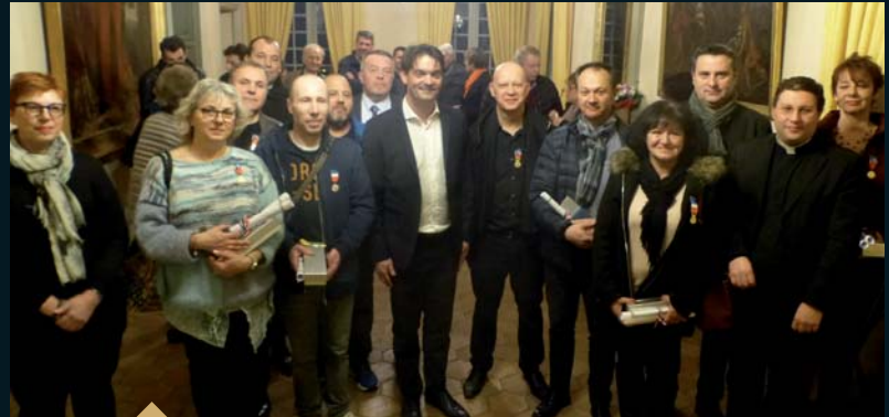
Remise des diplômes et des médailles d'honneur du travail dans le secteur privé (12 février)