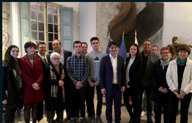
Mise à l'honneur des lauréats Grassois du Concours des Meilleurs Apprentis de France 2017 (5 février)