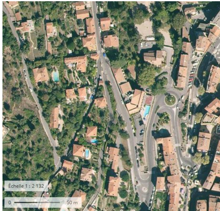
Localisation du secteur de la DP

Il n'existe pas de secteurs à caractère naturel qui ont vocation à être urbanisés.